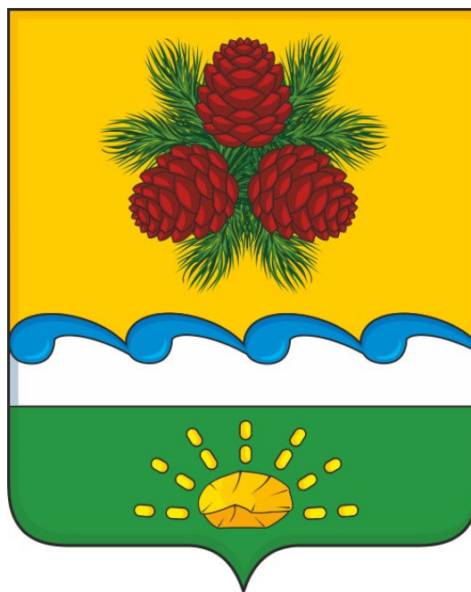
Герб муниципального образования «Чойский район» (пример воспроизведения в цвете)